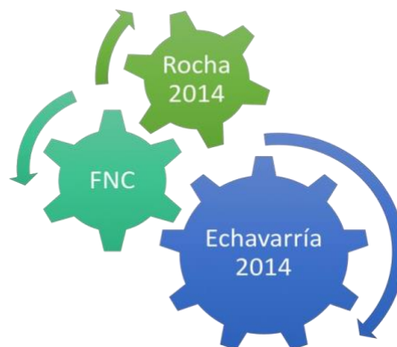
Ilustración SEQ Ilustración \* ARABIC 4. Engranaje conceptual, mercado

De acuerdo al estudio realizado por Rocha (2014), en el mercado laboral cafetero a 2012, hubo 703 mil ocupados para suplir una demanda de 714 mil trabajadores en el sector, sin embargo, los resultados son dispares a nivel departamental. De acuerdo con la Tabla 2., La demanda de trabajadores en los departamentos de Quindío, Risaralda, Caldas, Tolima, Antioquia, Magdalena, Cundinamarca y Cesar es deficitaria en un 39,10%, la cual es compensada estacionalmente por los